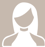
CONFEZIONISTE garment maker