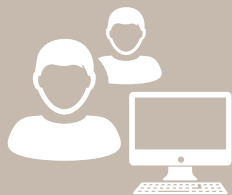
TECNICI MAGLIERIA technicians

Every season our team of skilled experts explores future and current trends in all aspects of the knitwear industry and beyond. This is done completely in-house from the first to the last stage. In fact, we have the following people on board: